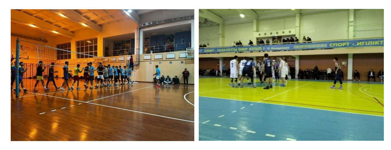
Pic. 3. Indoor courts for volleyball and basketball