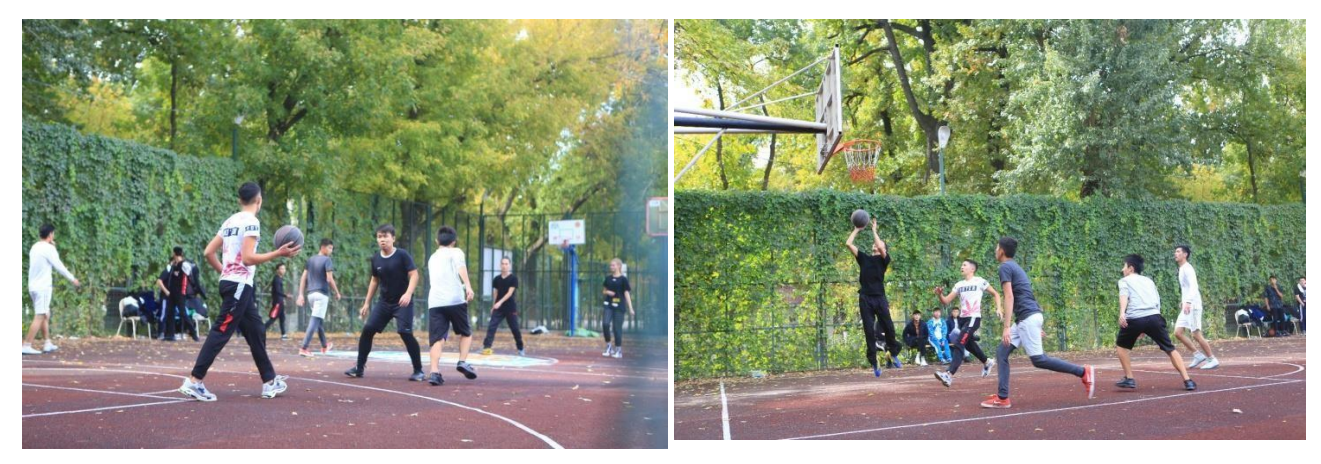
Pic. 4. Outdoor courts