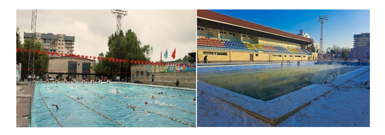
Pic. 1. Outdoor swimming pool Spartak