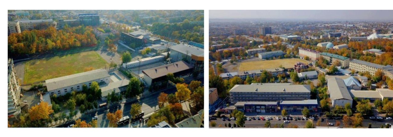
Pic. 5. Stadiums: Spartak and Burevestnik