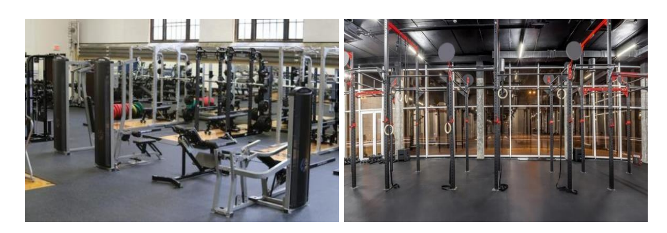
Pic. 2. Indoor fitness gym