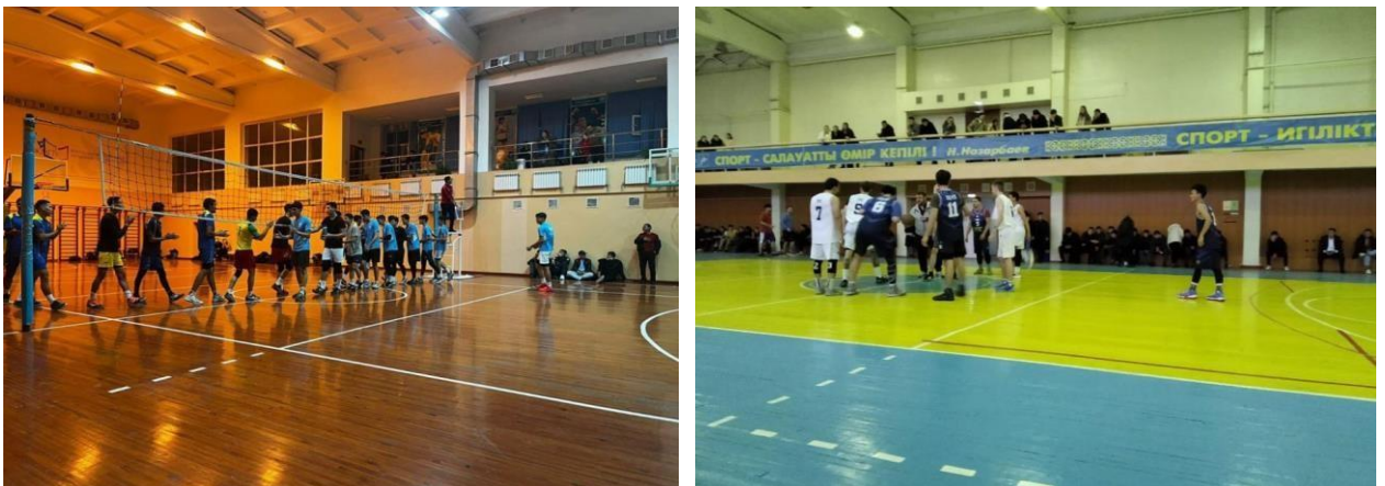
Рис. 3. Крытые площадки для волейбола и баскетбола