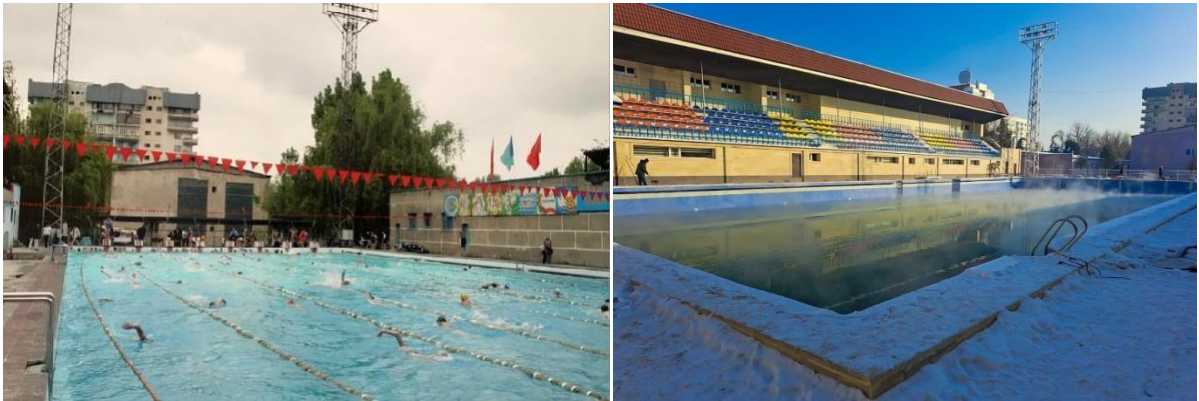
Рис. 1. Открытый бассейн Спартак