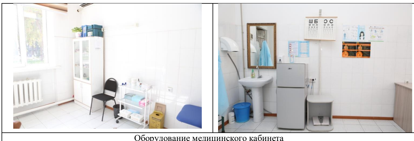
Оборудование медицинского кабинета