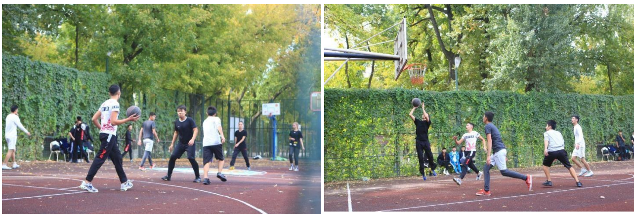
Рис. 4. Открытые корты