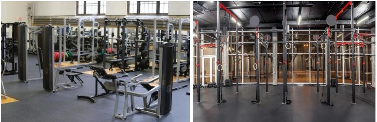
Рис. 2. Крытый фитнес-зал