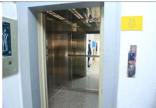
Лифты для использования посетителями и лицами с особенностями. Имеются в высотных зданиях