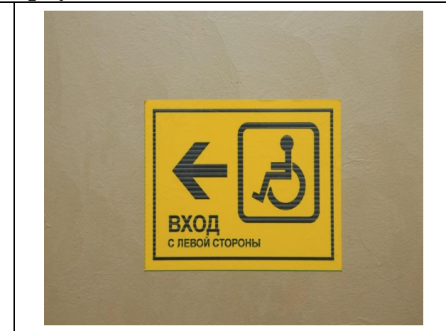
Тактильные пиктограммы на вертикальных поверхностях. Имеются в каждом корпусе