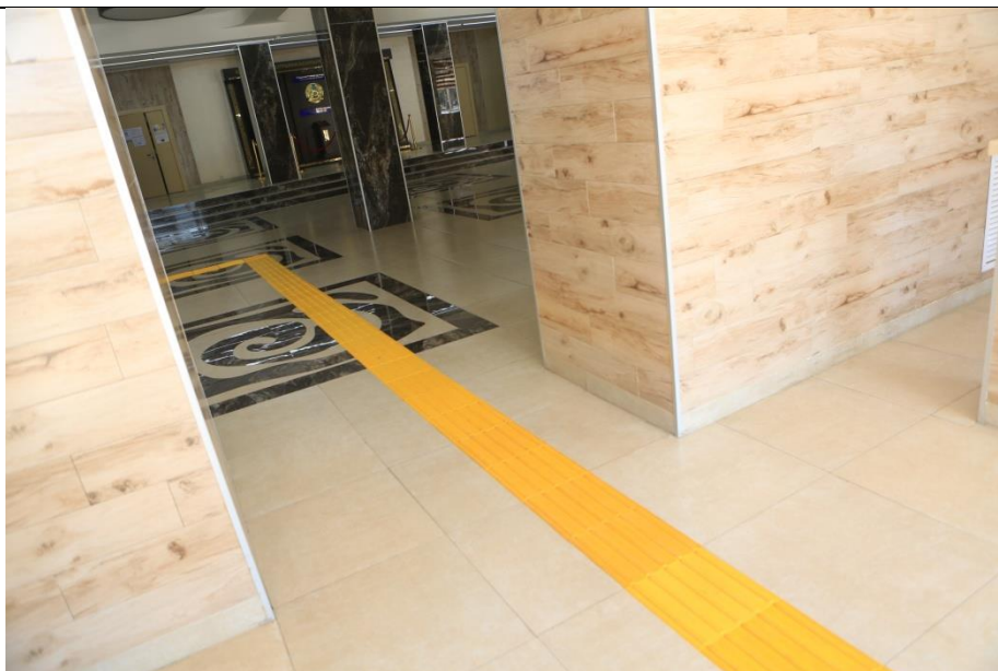
Тактильная плитка для слабовидящих и инвалидов. Имеются в каждом корпусе